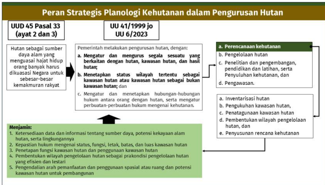
Gambar 3. Peran Strategis Ditjen Planologi Kehutanan dalam Pengurusan Hutan

Dengan memperhatikan sasaran Pembangunan nasional 2025-2029, program kerja Presiden dan Wakil Presiden periode tahun 2024-2029, peran strategis Planologi Kehutanan dalam pengurusan hutan serta prioritas utama perkembangan kegiatan kehutanan hingga saat ini, maka terdapat beberapa Isu Strategis Pembangunan 2025-2029 yang relevan dengan bidang Planologi Kehutanan.